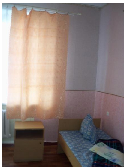
Одноліжкова палата дитячого відділення.

Котелевська ЦРЛ успішно пройшла оцінку на відповідність статусу «Лікарні, доброзичливої до дитини».