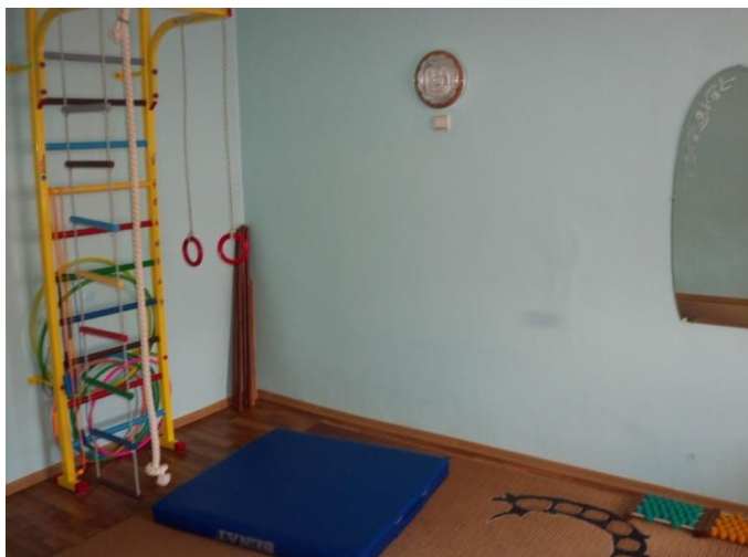
Кабінет ЛФК дитячого відділення.

За останні роки значно поліпилася матеріально-технічна база Котелевської ЦРЛ.